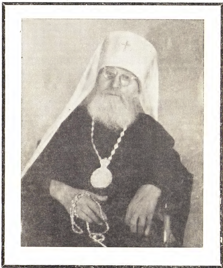
МИТРОПОЛИТ МАКАРИЙ, ПАТРИАРШИЙ ЭКЗАРХ В АМЕРИКЕ (Ум. 12 ноября 1953 г.)